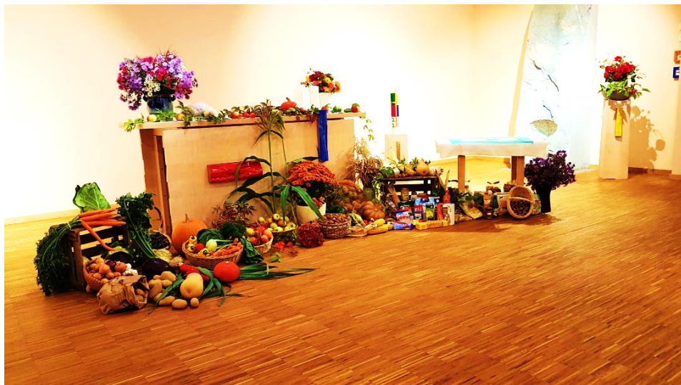
Erntedankaltar- Foto von Silke Panhoff-Brotz

Evangelische Kirchengemeinden Heitersheim/ Eschbach und Gallenweiler Unterer Gallenweilerweg 2, 79423 Heitersheim