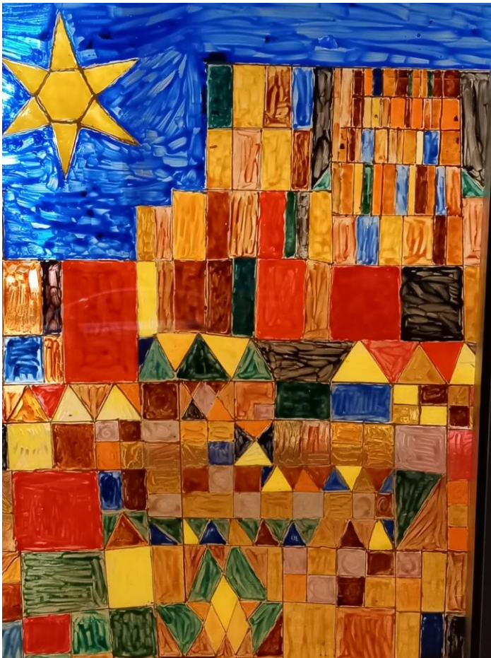
Adventsfenster Gallenweiler Renate Kilwing